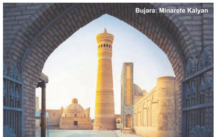
Bujara: Minarete Kalyan

Traslado temprano al aeropuerto para salir en vuelo de regreso, vía Estambul, a España. Llegada al aeropuerto de Barajas y fin del viaje.