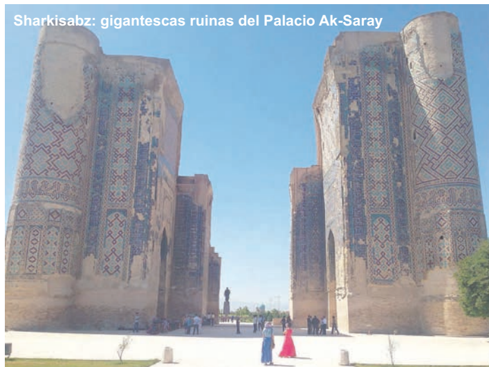
Sharkisabz: gigantescas ruinas del Palacio Ak-Saray

Después del desayuno, salida hacia Sharkisabz (130 km aprox.), la "Ciudad Verde", lugar natal de Tamerlán y una de las más bellas del país. Llegada y visita de las ruinas del Palacio Ak-Saray (siglos XIV-XV), "el Palacio Blanco", del que solamente se conservan partes de su gigantesca entrada, el Complejo Dorut Saodat y la Mezquita Hazrat-i Imam del siglo XVI, el Mausoleo de Jahongir