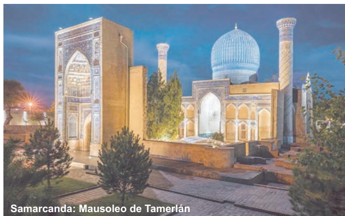
Samarcanda: Mausoleo de Tamerlán

de Amir Temur, Plaza de Ópera y Ballet y Monumento del terremoto. Cena en restaurante. Alojamiento.