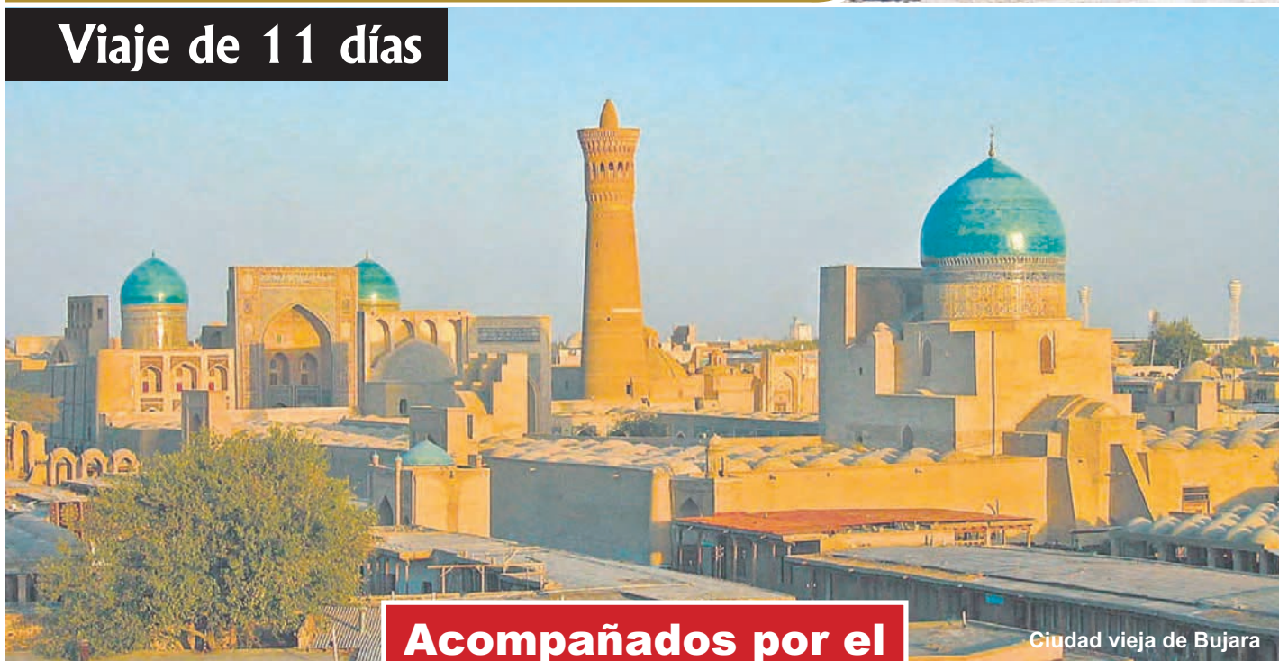
Ciudad vieja de Bujara