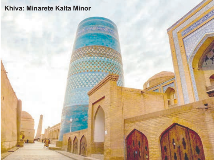
Khiva: Minarete Kalta Minor

y la cripta (siglo XII). Visita del Complejo Dorut Tilovat (siglo XV), con la Mezquita Kok Gumbaz, donde yacen los restos del padre de Tamerlán. Almuerzo en una casa local. Por la tarde, continuación a Bujara (290 km), una de las grandes joyas del país, cuyo casco histórico es un mar de cúpulas azuladas. Llegada y cena en restaurante. Alojamiento.