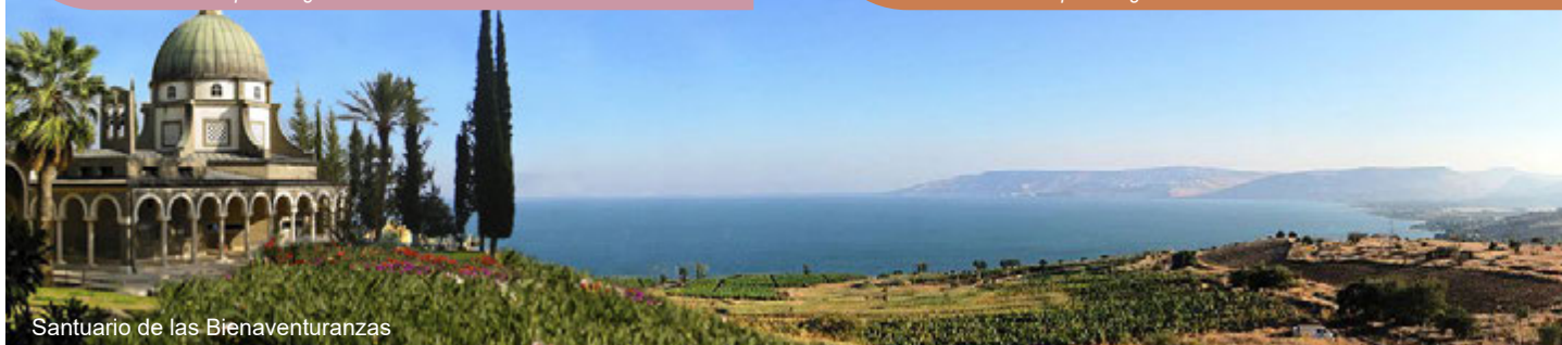
Santuario de las Bienaventuranzas