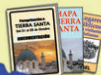
Información completa, etiquetas...