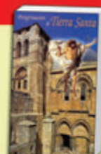
Libro-Guía de Tierra Santa