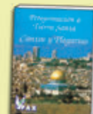
Libro de Cantos y Plegarias

Cada día se celebrará la Santa Misa en los lugares más significativos