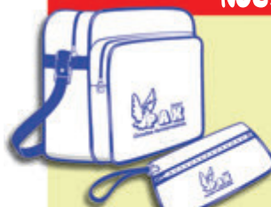
Bolsa y cartera documentación